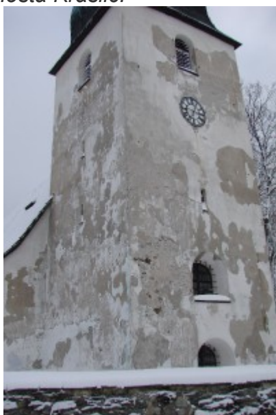
Věž kostela sv.Jiljí Kostelní

Zastupitelé Města Kraslic pozastavili do 12.03.2015 rozhodnutí k žádosti naší farnosti o příspěvek ve výši 50tis.Kč pro dokončení opravy střechy kostela Božího Těla v Kraslicích. Dal jsem si práci a vyčísil i pro vaši informaci, kolik kdo přispěl na opravy všech objektů, spadajících do správní oblasti Města Kraslic.