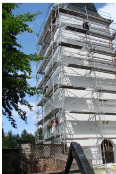
během poslední opravy