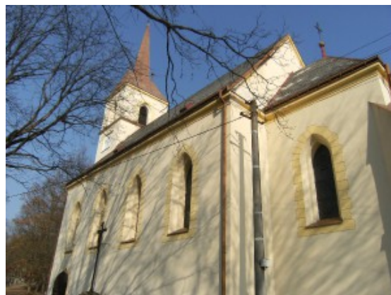
Kostel Nejsvětější Trojice v Liboci