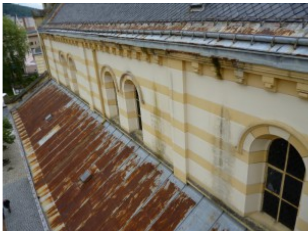
Kostel Božího Těla před opravou

Abyste si mohli udělat představu, co se za těmito čísly skrývá, bylo by jistě dobré, seznámit se s opravami těchto objektů; víme všichni velice dobře, že se peníze dají utratit i za nekvalitní či i předraženou práci! V našem případě se tak nestalo - díky Bohu! A také díky velkorysé podpoře rodáků z Německa! I oni měli zájem, kam jdou jejich příspěvky. Je to jistě dobrý vklad i pro budoucnost!