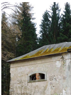
12. Kaple sv.Vojtěcha KRASLICE Skelná