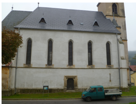
4.Kostel sv.arch.Michaela OLOVÍ