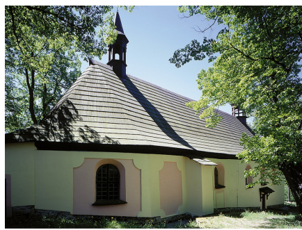
7.Kostel sv.Jakuba SNĚŽNÁ