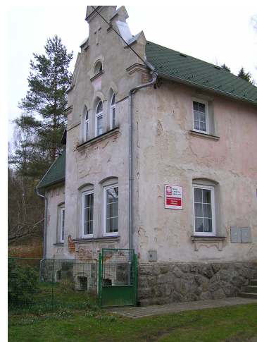
16.Farní budova STRÁŽBRNÁ

Kromě těchto objektů je naše farnost Kraslice majitelem i dvou bytů: