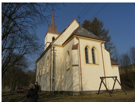
10.Kostel Nejsvět.Trojice LIBOC