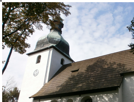
8.Kostel sv.Jiljí KOSTELNÍ