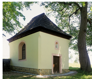
13.Kaple sv.Kříže SNĚŽNÁ