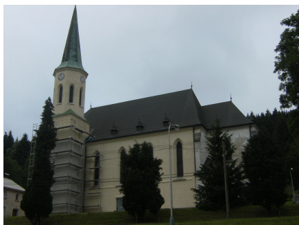
5.Kostel N.Srdce Páně STRÁŽBRNÁ