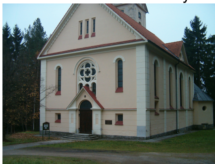
2.Kostel sv.Petra a Pavla ROTAVA