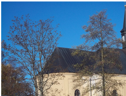
9.Kostel sv.Bartoloměje PŘEBUZ