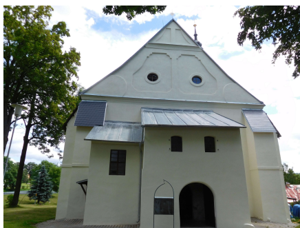
3.Kostel sv.Martina JINDŘICHOVICÍCH