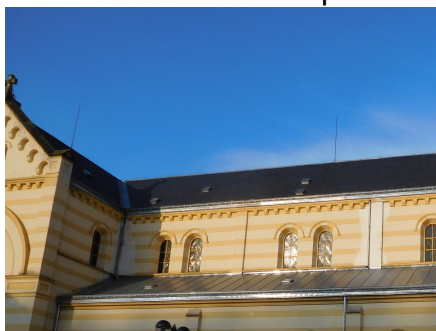
1.Kostel Božího Těla KRASLICE

Kraslice 11.09.2017 pro BP PLZEŇ - OBJEKTY kostely a kaple ŘKF Kraslice