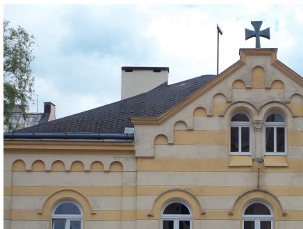
14.Farní budova KRASLICE