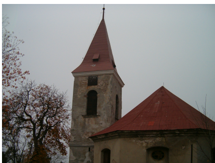
11.Kostel sv.Josefa KRÁSNÁ LÍPA