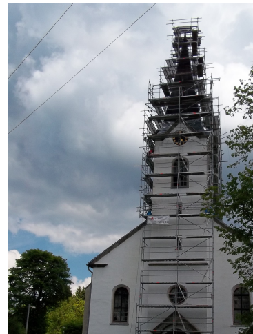
6.Kostel Naneb.PM BUBLAVA